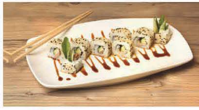
S7 Peking Ente, Gurke, Rucola, Schnittlauch T, j 9,90 €