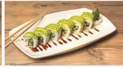
S3 Avocado, gr. Spargel, Rucola, Gurke T, 9 8,20 €