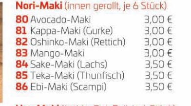
Nori-Maki (innen gerollt, je 6 Stück) 80 Avocado-Maki 3,00 € 81 Kappa-Maki (Gurke) 3,00 € 82 Oshinko-Maki (Rettich) 3,00 € 83 Mango-Maki 3,00 € 84 Sake-Maki (Lachs) 3,50 € 85 Teka-Maki (Thunfisch) 3,50 € 86 Ebi-Maki (Scampi) 3,50 €