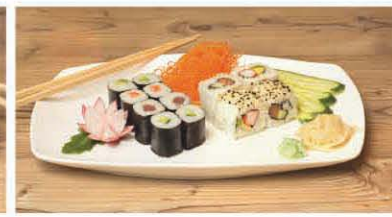
T3 Lachs, Thunfisch, Gurke, Avocado, California, Alaska T, b, d, j, a, c 6,50 €