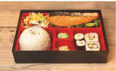
B1 gebr. Lachsfilet in Teriyaki-Sauce 1, 5, f