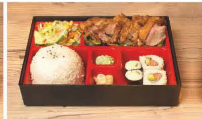
B6 Ente knusprig in Teriyaki-Sauce 1, 5, f