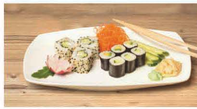
T1 Gurke, Avocado, Philadelphia T, 9, j 5,20 €