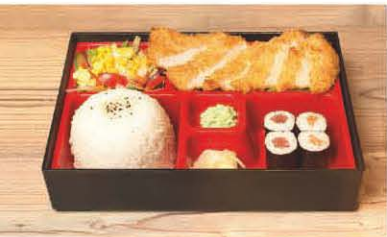
B4 Hähnchen knusprig in Curry-Sauce 1, 5, f