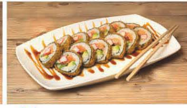
S10 Frittierte Futo Maki T, b, d 8,50 €