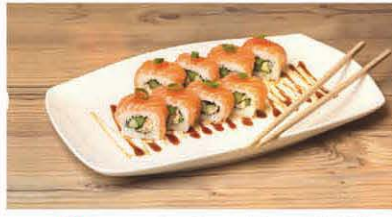
S1 Lachs, Aal, Gurke T, d 8,90 €