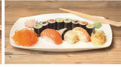
T6 Lachs, Thunfisch, Gurke Rettich, Shrimps, Tilapiafilet T, b, d 7,90 €