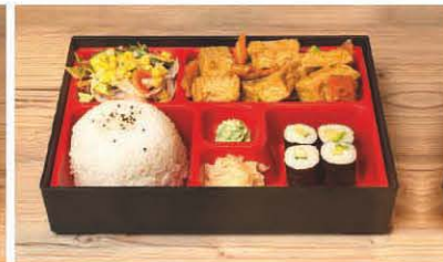
B3 gebr. Tofu und Gemüse vegetarisch 1, 5, f