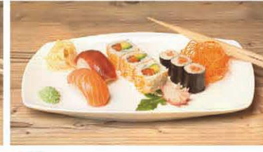
T5 Lachs, Thunfisch, Tobikko T, d 7,20 €