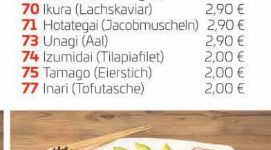
S13 Moriavase Sashimi T, d 18,90 €

Allergene: a) Gluten, b) Krebstiere, c) Eier, d) Fische, e) Erdnüsse, f) Soja, g) Milch, h) Schalenfrüchte, i) Sellerie, j) Sesam, k) Schwefeldioxid, l) Lupinen, m) Weichtiere Zusatzstoffe/Allergene: 1) Farbstoff, 2) Konservierungsstoffe, 3) Antioxidationsmittel, 4) Geschmacksverstärker, 5) Süßungsmittel, 6) enthält eine Phenylalaninquelle, 7) Tartrazin