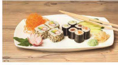
T4 Lachs, Thunfisch, Gurke, California T, b, d, j 5,50 €