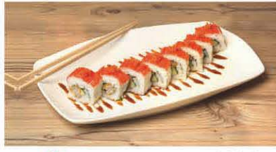
S4 Tempura Garnelen, Surimi, Gurke, Eissalat T, b, d 8,90 €