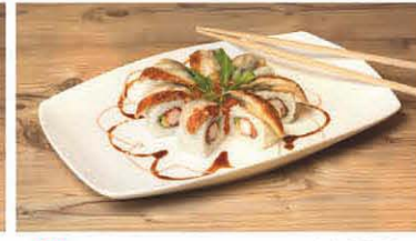
S5 Aal, Lachs, Avocado, Surimi T, d 10,90 €