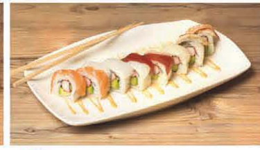
S8 Sepia, Lachs, Thunfisch Avocado, Spargel T, d 8,90 €