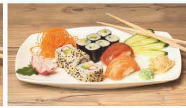
T2 Lachs, Thunfisch, Gurke, Avocado, California T, b, d, j 6,90 €