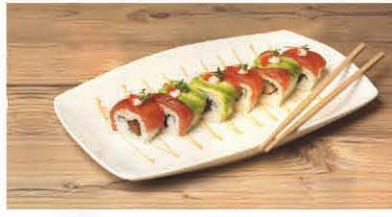
S9 Thunfisch mit Chili, Avocado, Lauchzwiebeln T, d 9,90 €