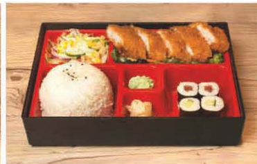
B5 gebr. Pangasius in Tamarin-Sauce 1, 5, f