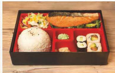
B2 gebr. Lachsfilet in Curry-Sauce 1, 5, f