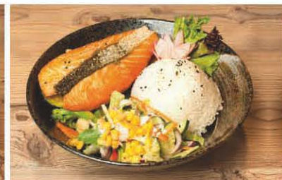
R3 Reis mit gegrilltem Lachs in Teriyaki-Sauce 1, 5, f