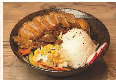
R2 Reis mit knuspriger Ente in Teriyaki-Sauce 1, 5, f