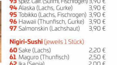
Ura-Maki (Inside-Out-Roll, je 6 Stück) 91 Horensu (grüner Spargel) 3,50 € 92 California (Surimi, Avocado) 3,50 € 93 spez. Calif. (Surimi, Fischrogen) 3,90 € 94 Alaska (Lachs, Gurke) 3,90 € 95 Tobikko (Lachs, Fischrogen) 3,90 € 96 Hawaii (Thunfisch, Gurke) 3,90 € 97 Salmonskin (Lachshaut) 3,90 €