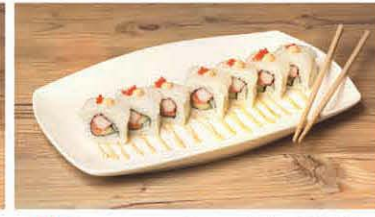
S2 Sepia, Lachs, Surimi T, b, d 8,50 €