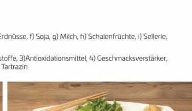
S12 Lachs & Thunfisch Sashimi T, d 14,90 €