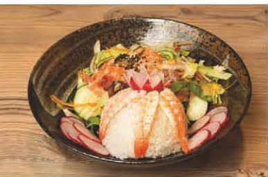
R1 Reis mit mariniertem Fisch in Soja-Sesam-Sauce 1, 5, 4, f