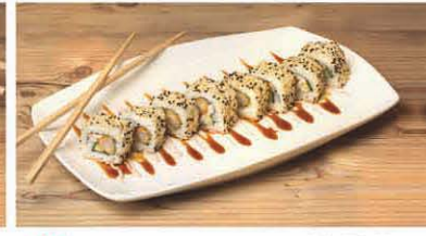
S6 Frittierter Soft-Shell-Krebs, Shrimps, Gurke T, b, j 10,50 €